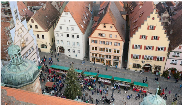
Sicht auf den Marktplatz