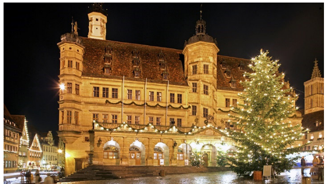
Und dem schönen beleuchteten Weihnachtsbaum