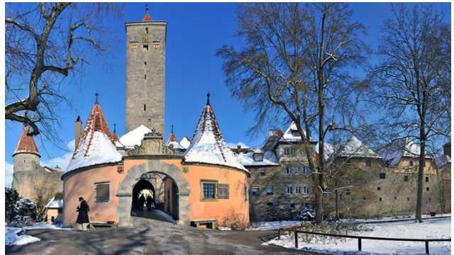
und im winterlichen Kleid