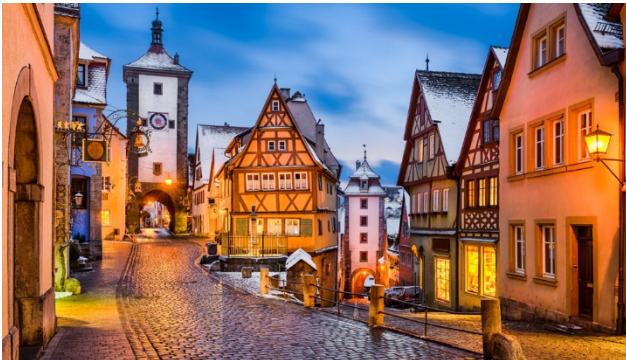
Rothenburg ob der Tauber in romantischer Abendstimmung

Schlanke Türmchen und imposante Wehranlagen, verwinkelte Gässchen mit malerischen Erkern; mächtige Kirchen, die zu Stille und Gebet einladen – all das verbinden Besucher aus aller Welt mit der historischen Altstadt von Rothenburg. Schon seit dem 15. Jahrhundert wird die festliche Adventszeit durch einen wundervollen Weihnachtsmarkt begleitet. Auf über 500 Jahre gelebte Tradition kann dieser Markt zurückblicken und es hat sich wohlweislich nur wenig seit seinem historischen Ursprung geändert.