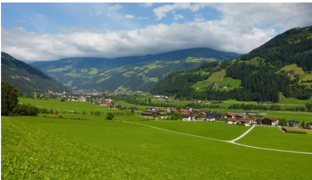
Einmalige Berglandschaften um Zell