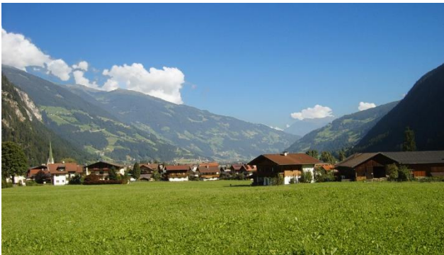
Rund um Zell im Zillertal

Erleben Sie eine schöne Sommerzeit im idyllischen Ferienort Zell am Ziller auf 580 mü.M. gelegen! Es erwarten Sie sportliche Aktivitäten und spannender Freizeitspass. Sie können wunderbar die Landschaft erkunden: Die faszinierende Bergkulisse und die saftigen Bergwiesen werden Sie bestimmt begeistern. Auf zahlreichen Wanderwegen können Sie die Bergwelt kennen zu lernen. Die Ausflüge in die nähere Umgebung runden das vielfältige Angebot ab. Die Bergwelt, die Zell am Ziller umgibt, eignet sich hervorragend, um in Ruhe Kraft zu tanken! Machen Sie sich fit für den Alltag und genießen Sie die unzähligen Möglichkeiten der individuellen Entspannung.