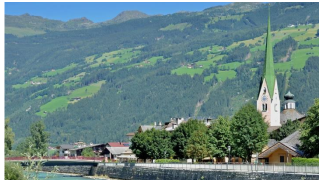
Die Kirche von Zell