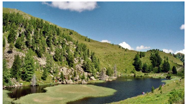
Landschaft an der Nockalmstrasse