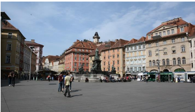
Landeshauptstadt der Steiermark – Graz