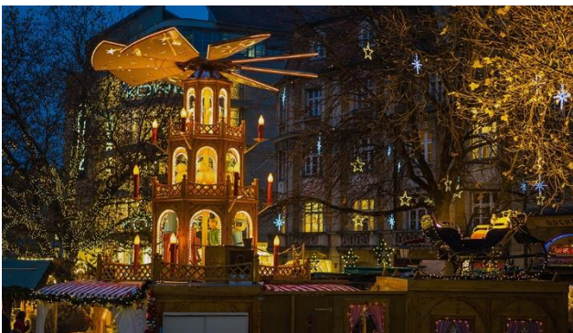
Schöne Stimmung am Christkindlmarkt

Tradition und Moderne – stille Gotik, praller Barock, fesche Trachten und elegante Designermode, rustikale Biergärten und edle Restaurants lassen das Besucherherz höherschlagen. München hat für jeden etwas zu bieten und dass zu jeder Jahreszeit. Weihnachtliche Vorfreude kommt auf beim Flanieren durch die festlich beleuchtete Fussgängerzone. Kulinarische Spezialitäten wie Bratäpfel und Honigkuchen gehören zum Münchner Christkindlmarkt wie der Schnee zum Winter. Geniessen Sie den vorweihnachtlichen Charme auf dem wunderschön beleuchteten Marienplatz.