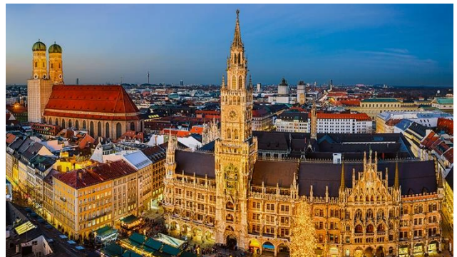
Die Alpenmetropole im Lichterglanz