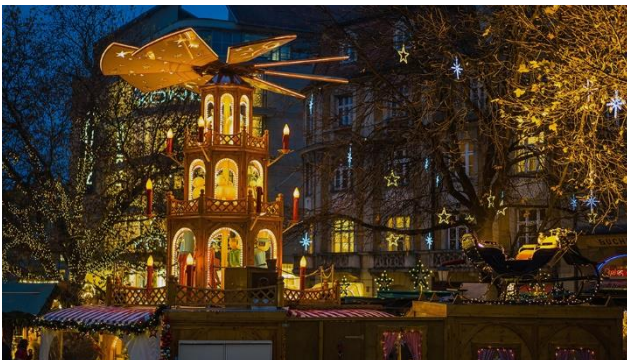
Schönste Stimmung am Christkindlmarkt

Tradition und Moderne – stille Gotik, praller Barock, fesche Trachten und elegante Designermode, rustikale Biergärten und edle Restaurants lassen das Besucherherz in München höherschlagen. Die Alpenstadt hat für jeden etwas zu bieten und das zu jeder Jahreszeit. Weihnachtliche Vorfreude kommt auf beim Flanieren durch die festlich beleuchtete Fußgängerzone und beim Besuch der über hundert Buden. Ebenso beim Bestaunen des Wahrzeichens des Marktes – der mit über 2 500 Lichtern geschmückte Weihnachtsbaum am Marienplatz. Kulinarische Spezialitäten wie Bratäpfel und Honigkuchen gehören zum Münchner Christkindlmarkt wie der Schnee zum Winter.