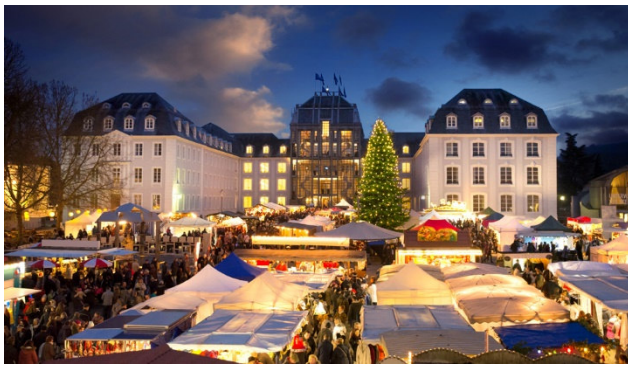
Weihnachtsmarkt in Saarbrücken

Drei auf einen Streich – erleben Sie in der Vorweihnachtszeit drei Länder und drei tolle Städte. Marché de Noël in Metz, Saarbrücker Christkindl-Markt mit dem fliegenden Weihnachtsmann und den Luxemburger Kreschmaart. Nirgends ist es leichter, den Charme der drei Nachbarländer, Menschen und ihre Bräuche kennen zu lernen und mit allen Sinnen zu genießen.