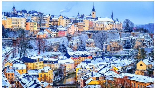
Luxemburg im Winterkleid