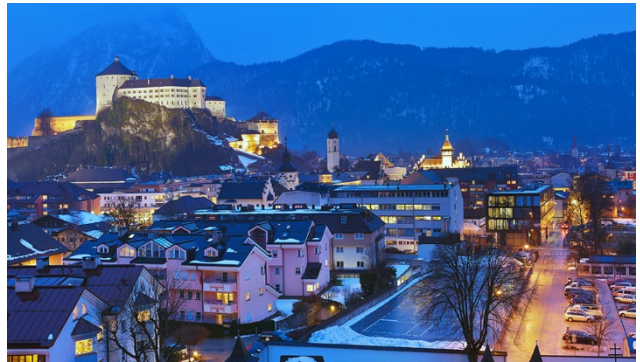
Kufstein mit Festung