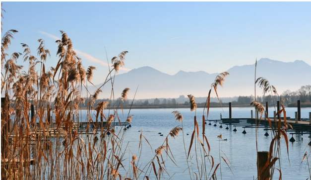
Chiemsee mit seiner Bergwelt

Auf dieser zweitägigen Rundreise genießen Sie weihnachtliche Stimmung in der bayerischen Ortschaft Prien. Erleben Sie romantische Stunden direkt am Chiemsee. Danach geht es weiter ins Tirol nach Kufstein am grünen Inn. Die Festung Kufstein, das Wahrzeichen der Stadt, erstrahlt im weihnachtlichen Zauber und auch die schmucke Altstadt wartet auf Sie.