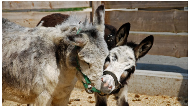
Esel Rudi auf Gut Aiderbichl

■ Charmante Kurstadt Bad Tölz ■ Traumhafte Landschaft ■ Wintermärchen Gut Aiderbichl