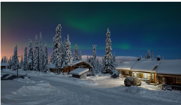
Nordlicht auf Lappland

Warum im Winter in den Norden? Da ist es doch kalt und dunkel. Kalt stimmt, aber gegen die Kälte kann man sich ja warm anziehen und zudem gibt es beheizte Häuser. Dunkel ja, zu gewissen Zeiten, aber Mitte März sind die Tage in Rovaniemi praktisch gleich lang wie bei uns in der Schweiz. Speziell ist das Licht, wenn die Sonne in die tief verschneite Landschaft scheint, der Schnee glitzert und die tollen Wolkenbilder dazukommen, dann wird es jedem Winterliebhaber warm ums Herz. Mit etwas Glück können wir in einer klaren Nacht sogar das Nordlicht sehen. Zudem gibt es Aktivitäten, die man nur im Winter machen kann: Eine Schifffahrt mit dem Eisbrecher Sampo, eine Hundeschlitten Safari, eine Rentiersafari oder einen Ausflug mit dem Schneemobil. Ein spezielles Erlebnis im Winter ist die Zugsfahrt durch verschneite Landschaften.