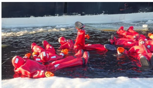
mit fakultativem Badeerlebnis im Trockenanzug