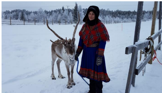
Rentier mit Lappländerin