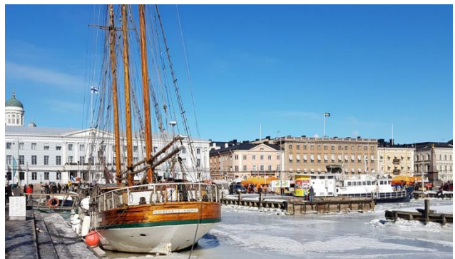
Winterstimmung in Helsinki