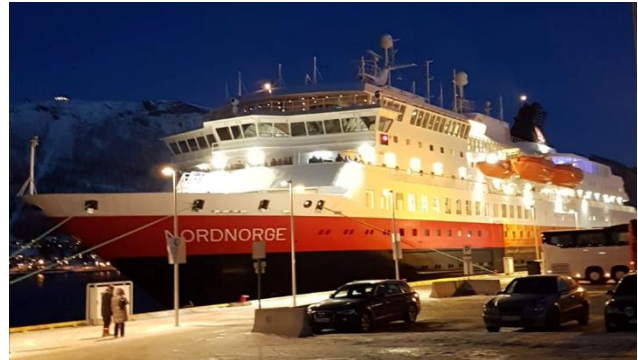
Mögliches Hurtigrutenschiff entlang der norwegischen Küste