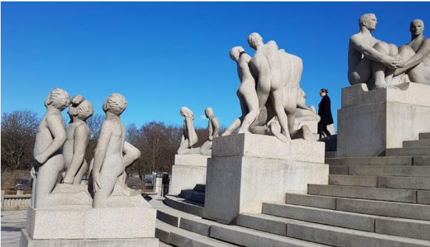
Oslo mit Vigelandpark

Wir werden mit einem wunderschönen Frühstücksbuffet verwöhnt, während das Schiff, in dem vom Winter verzauberten Oslofjord, einläuft. Auf einer Stadtrundfahrt entdecken wir die schönsten Sehenswürdigkeiten der norwegischen Hauptstadt Oslo. Nach der Führung verlassen wir Oslo und fahren Richtung Norden. Entlang des Mjosasees gelangen wir nach Lillehammer. Am Abend erreichen wir Dombås.