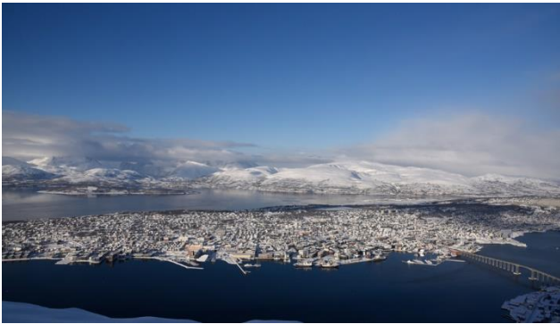
Tromsø aus der Vogelperspektive

Nach dem Frühstück verlassen wir die Küste und begeben uns auf die Reise durch das verzaubernde Lappland, das Land der Sami. Gegen Abend erreichen wir unser Hotel in Levi / Sirkka.