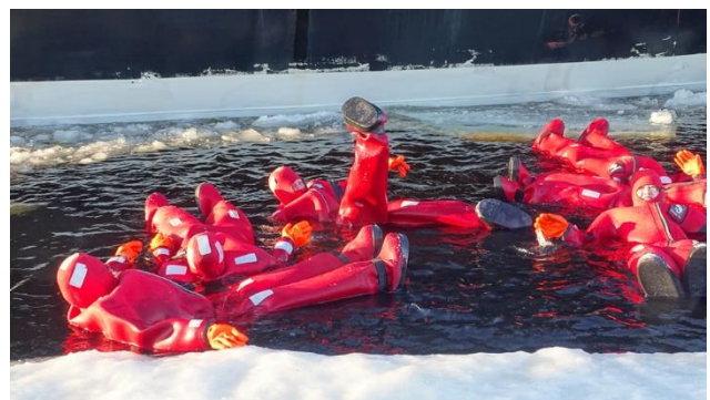
mit fakultativem Badeerlebnis im Trockenanzug