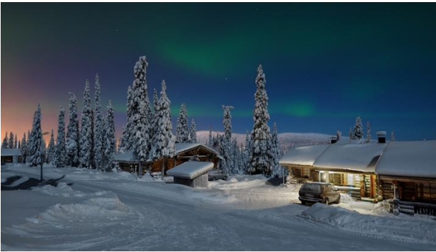
Nordlicht auf Lappland

Warum im Winter in den Norden? Da ist es doch kalt und dunkel. Kalt stimmt, aber gegen die Kälte kann man sich ja warm anziehen und zudem gibt es beheizte Häuser. Dunkel ja, zu gewissen Zeiten, aber Mitte März sind die Tage in Rovaniemi praktisch gleich lang wie bei uns in der Schweiz. Speziell ist das Licht, wenn die Sonne in die tief verschneite Landschaft scheint, der Schnee glitzert und die tollen Wolkenbilder dazukommen, dann wird es jedem Winterliebhaber warm ums Herz. Mit etwas Glück können wir in einer klaren Nacht sogar das Nordlicht sehen. Zudem gibt es Aktivitäten, die man nur im Winter machen kann: Eine Schifffahrt mit dem Eisbrecher Sampo, eine Hundeschlitten Safari, eine Rentiersafari oder einen Ausflug mit dem Schneemobil. Ein spezielles Erlebnis im Winter ist die Schifffahrt auf der Hurtigrute.