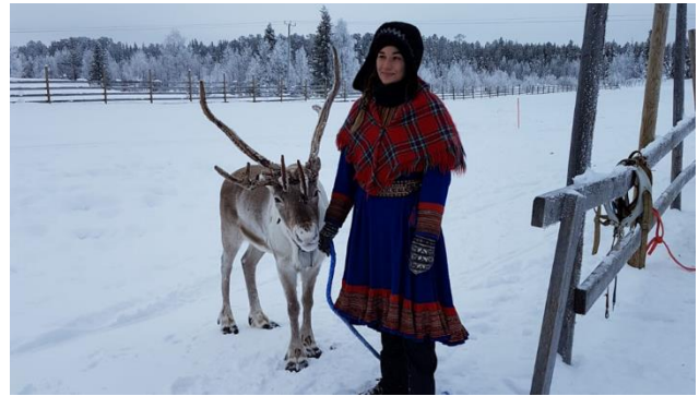
Rentier mit Lappländerin