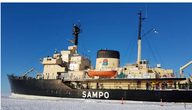
Imposante Fahrt mit dem Eisbrecher Sampo

Nach dem Frühstück fahren wir von Rovaniemi nach Kemi. Jeden Winter kommen Künstler aus vielen Regionen um hier einen unvergleichlichen Eispalast zu erbauen. Dieses Kunstwerk werden wir besuchen und von innen und aussen bestaunen. Am Mittag können wir an einer Schneeschuhwanderung teilnehmen oder es erwartet uns ein weiterer Höhepunkt unserer Reise – die Fahrt mit dem Eisbrecher Sampo. Die Sampo ist weltweit einer der wenigen Eisbrecher, die Passagiere aufnehmen. Während einer fachkundigen Führung lernen wir das Schiff kennen. Die in Edelholz und Messing gehaltenen Salons lassen bereits im Hafen Seefahrerstimmung aufkommen. Zur Stärkung erhalten wir im Restaurant unter Deck eine feine Suppe. Nach rund einer Stunde Fahrt stoppt der Eisbrecher und wir erhalten die Möglichkeit das Schiff zu verlassen, um es sich von aussen, vom Eis aus, zu betrachten. Ein Bad gefällig? Im warmen Trockenanzug kann es ein Erlebnis der besonderen Art werden.