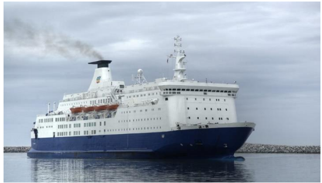
Erholsame Fährstrecken Kiel-Oslo und Helsinki-Travemünde