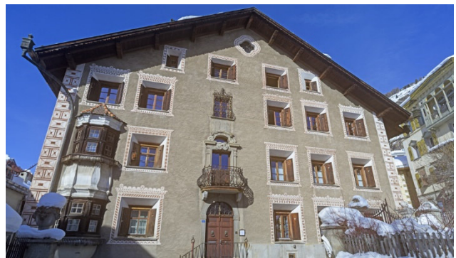
Schmucke Bündner Dörfer