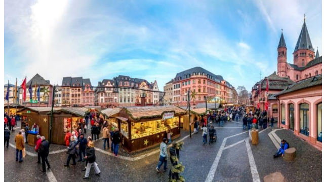
Domplatz in Mainz