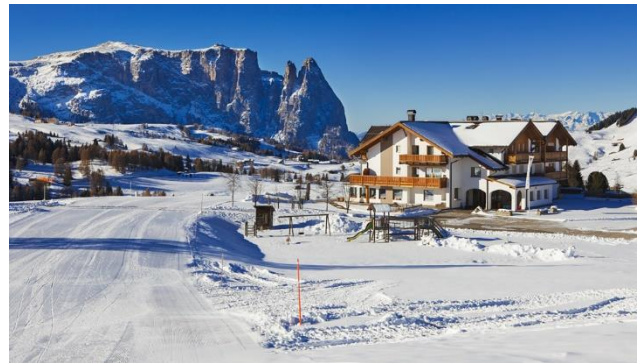
Winterliche Seiser Alm