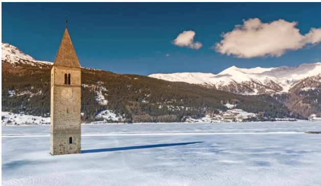
Kirchturm am Reschenpass

Die Ferienregion Vinschgau ist auch im Winter einen Besuch wert. Der glitzernde Schnee verzaubert die Dörfer entlang der Etsch und der höchste Berg Südtirols, der Ortler, wirkt dadurch besonders imposant. Ein schönes familiäres Hotel ist Ausgangspunkt für schöne Ausflüge nach Meran zum idyllischen Christkindmarkt und zur Seiser Alm mit ihrem prächtigen Panorama.