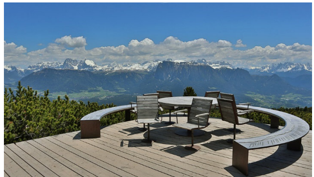
Aussicht vom Rittner Horn

■ Geführte Wanderungen durch einheimische Wanderleitung