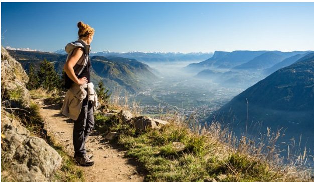
Unterwegs auf dem Meraner Höhenweg

Wandern im Südtirol bedeutet ein Genuss für die Sinne. Wir haben wiederum mit unserer langjährigen Südtiroler Reise- und Wanderleiterin ein neues attraktives Wanderprogramm für Sie zusammengestellt. Kommen Sie mit uns und genießen Sie in höher gelegenen Lagen angenehme Temperaturen und traumhafte unberührte Natur.