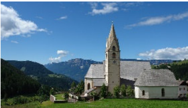
Kirche von Mölten