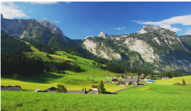
Abtenau im Salzburgerland

Kennen Sie Abtenau? Das beschauliche Feriendorf liegt auf 712 m Seehöhe im Ferienparadies Lammertal, mitten im schönen Salzburgerland. Ein Wanderparadies im Herzen der herrlichen Berge des Tennengaus mit der Postalm, Österreichs grösstem Hochplateau, im Gemeindegebiet von Abtenau.