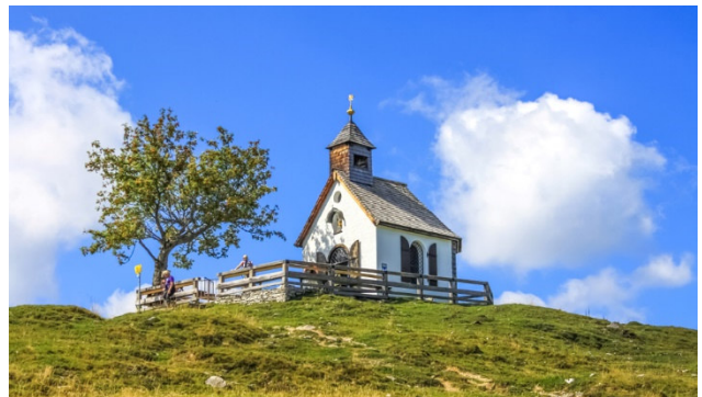
Kapelle auf der Postalm