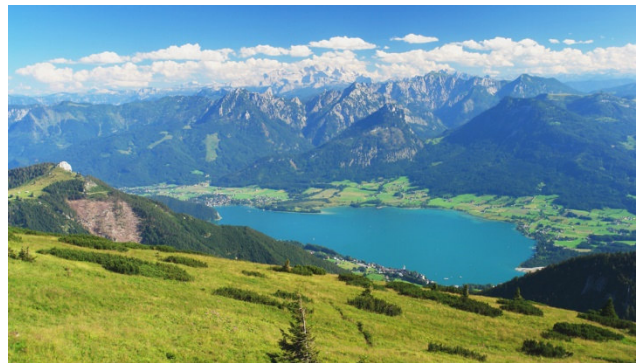
Aussicht vom Dachstein zum Wolfgangsee