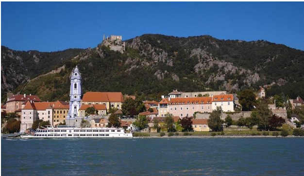
Donau mit Dürnstein

Das Weltkulturerbe Wachau in der niederösterreichischen Donauregion bietet eine Vielzahl an Kulturschätzen sowie eine Bilderbuchlandschaft mit paradiesischen Gärten und vielen Wein- und Obstterrassen. Brauchtum wird an der Donau grossgeschrieben. Der Wein wird ebenso gefeiert wie die Marille. Wandern Sie entlang dem Marillenpfad und geniessen Sie eine Verkostung der berühmten Marillenknoedel. Eine Führung durch das Stift Göttweig und die Stadt Krems sowie eine Schifffahrt auf der Donau dürfen natürlich nicht fehlen.