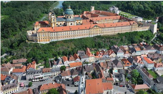
Stift Melk und die Altstadt