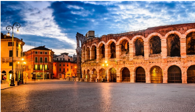
Verona in Abendstimmung

Verona, ein Name, mit dem man ganz bestimmte Vorstellungen verbindet: Stadt der Liebe, als Würdigung der unsterblichen Geschichte einer tragischen Liebe zwischen Romeo und Julia oder Tor nach Italien, dank der äusserst günstigen geografischen Lage. Verona ist eine Stadt mit einer tausendjährigen Geschichte. Vor den Augen der Besucher, die von Mitteleuropa herkommen, bietet sich Verona wie eine Perle von leuchtender und unbeschreiblicher Schönheit. Verona erleben heisst, sich auf den ersten Blick in die Stadt verlieben.