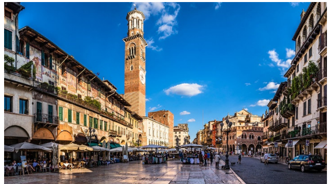
La Piazza delle Erbe

■ Faszinierende Oper Aida in der Arena di Verona ■ Kurzweilige Stadtführung Verona