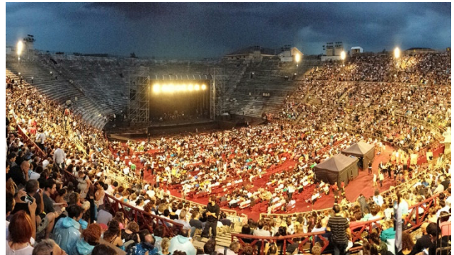
Tolle Stimmung in der Arena di Verona