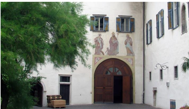
Bozen – Stift Muri Gries

Die einzigartige Natur sowie die zahlreichen interessanten Orte verbunden mit der Gastfreundlichkeit der Einwohner bieten eine schöne Umgebung, dazu gesellen sich kulinarische Genüsse: All dies trägt zu einer unvergesslichen Veloreise bei.