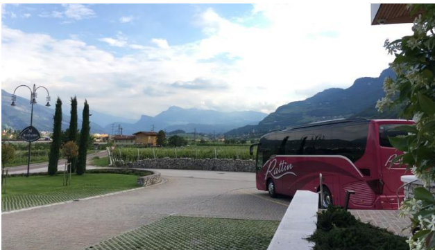
Der Car erwartet Sie, um Einkäufe zu tätigen in einer Destille