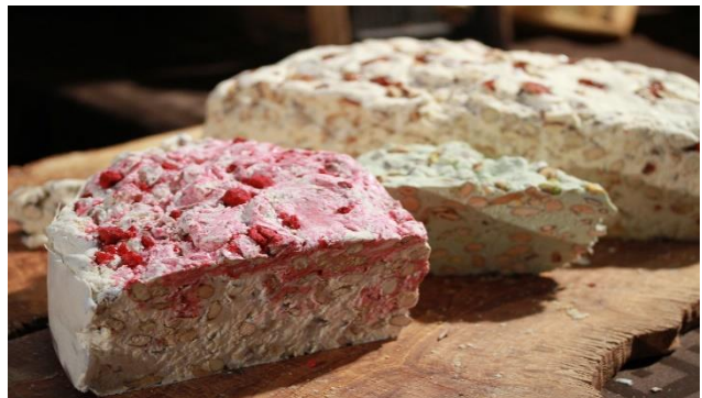
Montélimar - Nougat