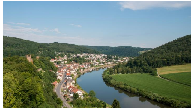
Traumhafte Landschaft am Neckar