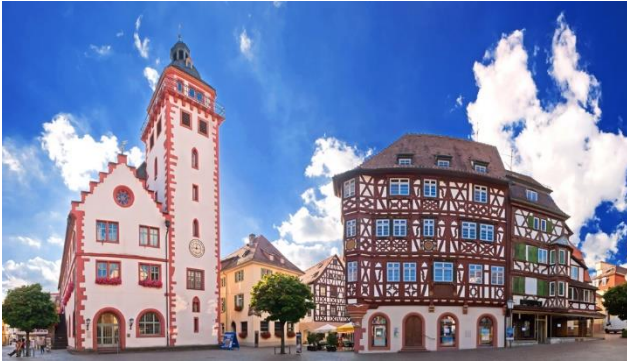
Mosbach am Neckar