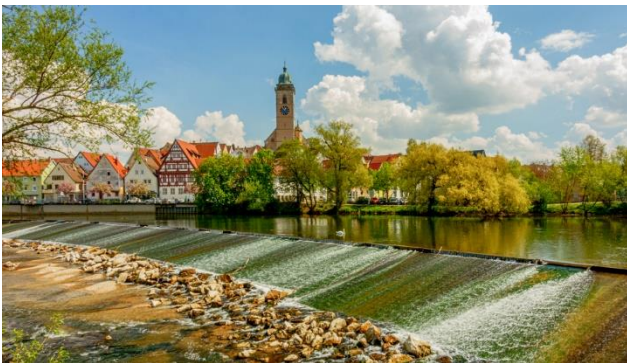
Nürtingen am Neckarradweg