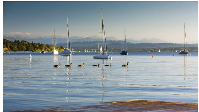
Ammersee – Blick von Herrsching zu den Alpen