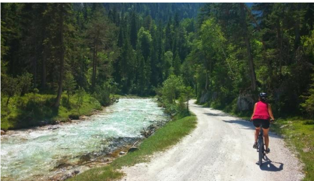
Velofahrer am Isarradweg

Oder machen Sie mit bei der Velotour durch den Englischen Garten. Diese Tour führt durch den südlichen Teil des Englischen Gartens und dabei an den Hauptattraktionen wie dem Chinesischen Turm, dem Eisbach mit den Surfern sowie dem Kleinhesseloher See vorbei. Anschliessend Rückfahrt zum Hotel und Abendessen.