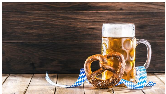
Kleine Stärkung im Biergarten gefällig?