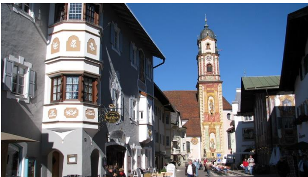
Mittenwald mit schönen Waldmalereien