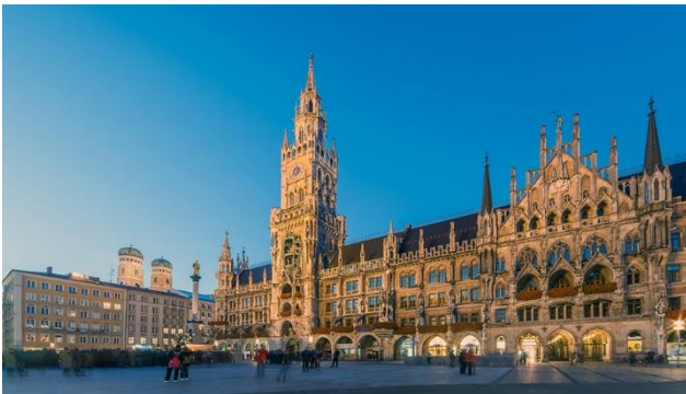
München, die Metropole mit Herz

Tradition und Moderne – stille Gotik, praller Barock, fesche Trachten und elegante Designermode, rustikale Biergärten und edle Restaurants lassen jedes Besucherherz Bayerns höher schlagen. Eine Veloreise, mit Unterkunft in München hat eine Menge zu bieten. Das vielzitierte Motto: «Leben und leben lassen» werden Sie an allen Ecken und Enden finden. Abwechslungsreiche Velotouren führen Sie durch ein besonderes Stück Bayern: Von der Metropole München der Isar entlang, an den Ammersee und Starnberger See sowie durch kleine verträumte Dörfer und abwechslungsreiche Landschaften.