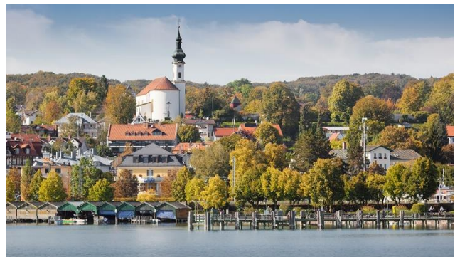
Idyllischer Starnberger See