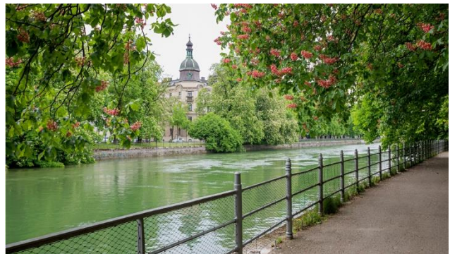
Uferweg an der Isar in München