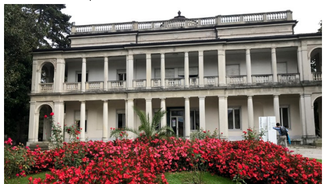
Architekturschule in Mendrisio