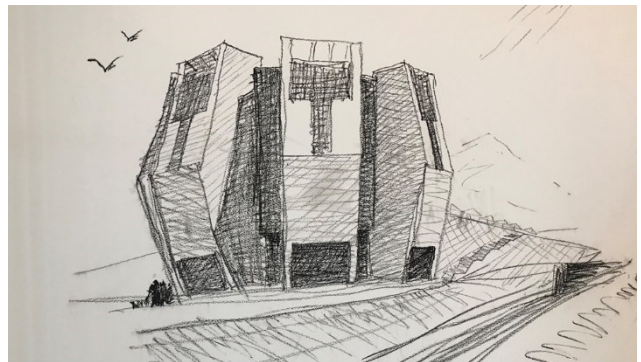
Entwurf «Fiore di pietra» auf dem Monte Generoso