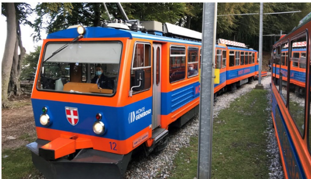
Monte Generoso Bahn

Auf der ganzen Welt und auch in seinem Heimatkanton Tessin trifft man auf Bauten vom bekanntesten Schweizer Architekten Mario Botta. Die einen mögen sie, anderen gefallen sie überhaupt nicht. An den Gebäuden von Mario Botta scheiden sich wahrlich die Geister. Aber egal, ob man seinen Stil mag oder nicht, dass er die zeitgenössische Architektur geprägt hat, steht ausser Frage. Auf dieser 4-tägigen Reise lernen Sie diese Architektur besser kennen und besuchen einige seiner Meisterbauten.