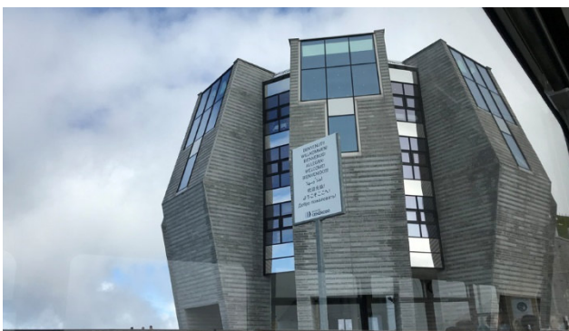
Original Bauwerk auf dem Monte Generoso