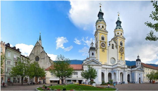
Dom in Brixen

Die diesjährige Technikreise bringt Sie einerseits tief ins Innere unter dem Brennerpass und andererseits hoch hinaus über Innsbruck. Entdecken Sie eines der grössten Bauprojekte in Europa; die Baustelle des Brenner-Basistunnels (BBT). Sie haben die Möglichkeit, die laufende Baustelle zu besichtigen und die Tunnelarbeiten aus nächster Nähe zu erleben. Hochhinaus geht es in Innsbruck auf der Skisprungschanze Bergisel. Auf der Führung mit einem Skispringer erhalten Sie unter anderem Einblicke in die Trainingsabläufe und die Schanzenkunde.