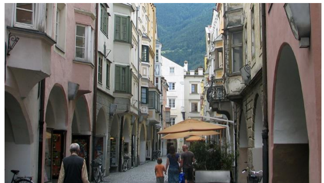
Altstadt von Brixen