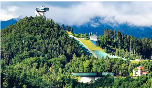
Skisprungschanze Bergisel oberhalb Innsbruck