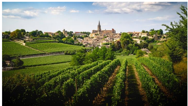
Saint-Émilion – eingebettet in seine Weinberge