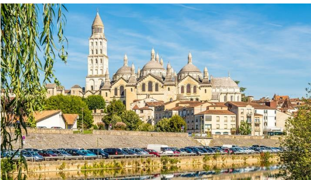
Périgueux im Herzen des Périgords

Bei einer Stadtführung werden Ihnen die Schätze der Stadt nähergebracht. Die Stadt, welche im Herzen des Périgords liegt, besitzt eine hübsche, denkmalgeschützte Altstadt, die sich am Fluss Isle um die grosse, ungewöhnliche Kathedrale Saint-Front, ausbreitet. Den Rest des Tages gestalten Sie nach Lust und Laune selbst. Mittwoch ist grosser Markttag in Périgueux. Bis nach der Mittagszeit werden auf verschiedenen Plätzen und Gassen Köstlichkeiten aus der Region angeboten. Ebenfalls findet jeweils mittwochs ein Textilmarkt statt.