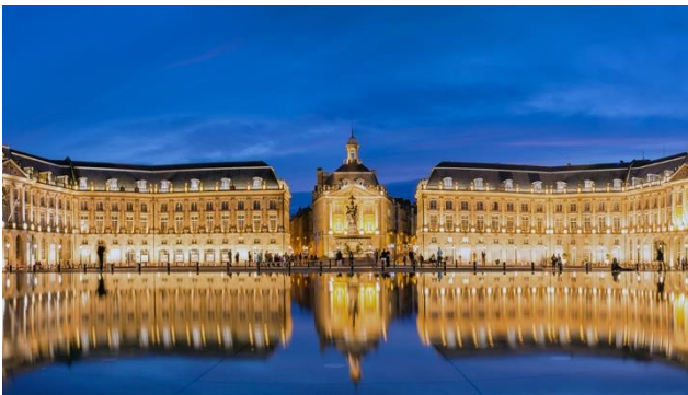
Der elegante Place de la Bourse in Bordeaux