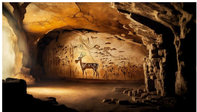
An der Höhle von Lascaux inspirierte Malerei.