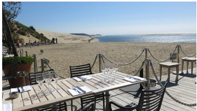
Atlantik mit Dune du Pilat

■ Abwechslungsreiche Landschaft ■ Kultur und Genuss ■ Leben wie Gott in Frankreich