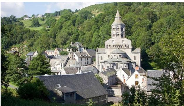
Die Basilique Notre Dame d'Orcival in der Auvergne

Die Auvergne mit ihren beeindruckenden Vulkanen weist eine sehr reizvolle Landschaft auf und wird nicht zu Unrecht auch «das grüne Herz Frankreichs» genannt. Die Reise führt Sie weiter durch das Périgord, eine Region, die mit ihren beeindruckenden Felsformationen, weitläufigen Flusstälern, Burgen und geheimnisvollen Höhlen ebenso zu verzaubern weiss. So gehört die Höhle von Lascaux zum Welterbe der UNESCO! Eine Weinregion mit wohlklingenden Namen ist das Bordeaux. Sie besuchen das malerisch in die Landschaft eingebettete Saint-Émilion. Das Weindorf ist weit über die Landesgrenzen aus bekannt für seine guten Weine und sein hübsches historisches Zentrum. Von Bordeaux aus unternehmen Sie eine Stippvisite zum Atlantik – zum Bassin d'Arcachon.