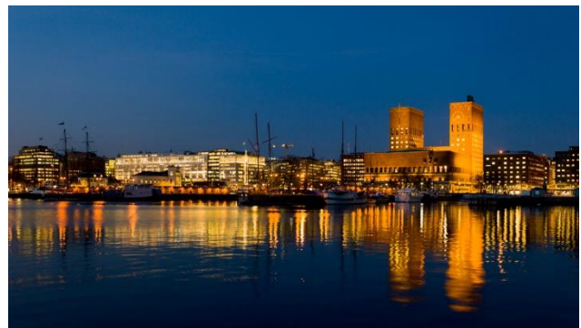
Oslo – Hall und Hafen