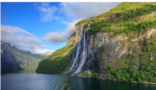
Geirangerfjord, prachtvoller Wasserfall «sieben Schwestern»