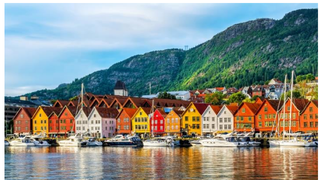
Bergen – die Stadt zwischen den sieben Bergen