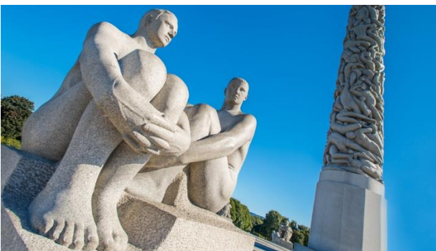
Vigelandpark in Oslo

Heute erwartet Sie ein Highlight. Mit dem Rattin-Car fahren Sie über imposante Gebirgsstrassen und entlang beeindruckender Fjorde nach Geiranger, das von einer einzigartigen Naturkulisse umgeben ist. Am Nachmittag starten Sie die atemberaubende Kreuzfahrt durch den Geirangerfjord. Er ist einer der engsten und schönsten Fjorde Norwegens. Während der Fahrt werden Sie prachtvolle Wasserfälle, darunter die „Sieben Schwestern“ und der „Brautschleier“ sowie schneebedeckte Berge sehen. Weiter führt die Schifffahrt durch den Storfjord bis zur Atlantikküste nach Ålesund. Erfreuen Sie sich an der imposanten Küstenlandschaft, der schönen Bergwelt im Hinterland und an der Naturvielfalt! Nach einer vielfältigen Kreuzfahrt, erreichen Sie Ålesund. Abendessen und Übernachtung im Hotel Noreg Ålesund.