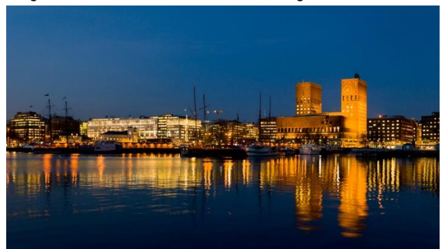
Oslo – Hall und Hafen