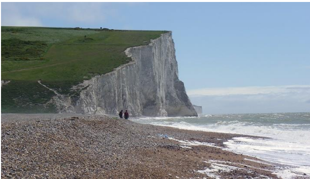
Seven Sisters – East Sussex

Südengland – der «Garten Britanniens» – erwartet den Besucher mit einer faszinierenden Verbindung von Landschaft und Kultur. Die Südregion Grossbritanniens gehört zu den schönsten Landschaften Europas. Entlang der gut 1000 km langen Küste finden Sie eine Reihe von romantischen Badebuchten und lange Sandstrände. Im Landesinnern erwarten Sie Zeugen alter Geschichte, kleine Dörfer mit reetgedeckten Cottages, stattliche Herrenhäuser und herrliche Gartenanlagen. Nicht umsonst wurden hier die berühmten Verfilmungen der Rosamunde Pilcher Romane gedreht. Neben der spektakulären Landschaft in Land's End sind die Unesco Stadt Bath und der Steinkreis Stonehenge als besondere Highlights dieser Reise hervorzuheben.