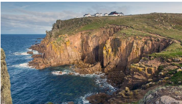
Hotel Land's End