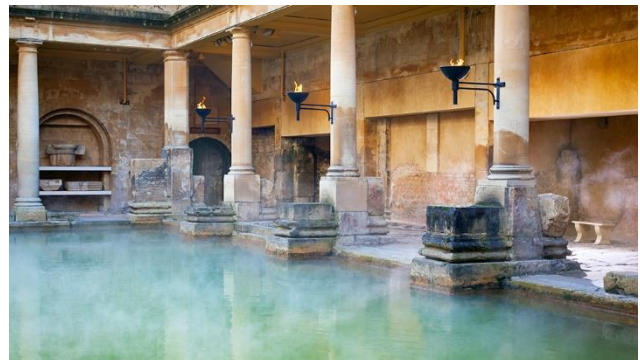
mit seinen Römischen Bädern