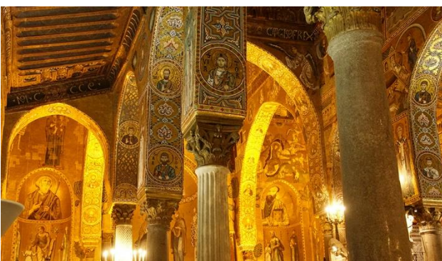
Capella Palatina in Palermo

Nach dem Frühstück besuchen wir heute gemeinsam den höchsten, noch aktiven Vulkan Europas, den Ätna. Die Fahrt auf das UNESCO-Weltnaturerbe ist ein wahres Erlebnis. Sie beginnt in der blühenden Ebene, vorbei an Orangen-, Zitronen-, und Olivenbäumen. Zudem passieren Sie kleine und liebeliche am Hang liegende Dörfer und Wälder, die je nach Höhe von Kastanienbäumen, Eichen bis hin zu Birken geprägt sind. Schon bald verändert sich die Landschaft und wird mit zunehmender Höhe fast ausschliesslich von Lavagestein geprägt. Unser Car bringt Sie auf zirka 2000 m ü. M., wo Sie Ihren Blick über die herrliche und eindrucksvolle Ostküste Siziliens schweifen lassen können. Nebst diesem Abenteuer steht heute auch das Städtchen Taormina auf dem Reiseprogramm. Der bekannteste Ferienort Siziliens erwartet Sie mit vielen historischen Bauwerken und liebevollen Gassen. Das mittelalterliche Stadtbild zeigt sich mit zinnengekrönten Palästen, Gassen und kleinen Plätzen, die meist durch Treppenwege verbunden sind. Ausserdem haben Sie vom Teatro Greco-Romano einen beeindruckenden Blick auf die Landschaft vom Ätna bis nach Kalabrien. Abendessen im Hotel.