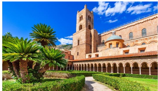
Kathedrale von Monreale