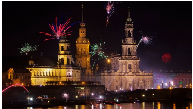
Silvester über der Elbe