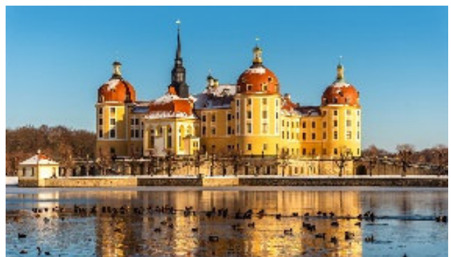
Schloss Moritzburg im winterlichen Glanz