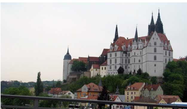
Historische Stadt Meissen