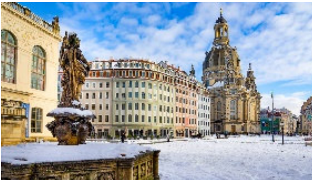
Dresden mit Frauenkirche im Winterkleid

Die wunderschöne Elbmetropole Dresden begeistert jeden seiner Besucher. Dank dem zentral gelegenen Hotel bei der Frauenkirche können Sie die barocke Altstadt bequem zu Fuss entdecken. Die einzigartige Flusslandschaft der Elbe, das barocke Schloss Moritzburg und der Charme der wunderschönen Bauten entlang der Elbe machen diese Region zu einem sehenswerten Reiseziel, auch in der Winterzeit. Am Silvesterabend können Sie vom Hotel aus die Feuerwerke über der Elbe beobachten und gemütlich das neue Jahr begrüßen.