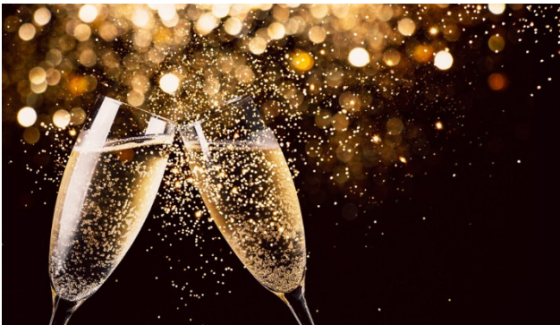
Happy New Year