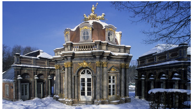
Orangerie und Sonnentempel in Bayreuth