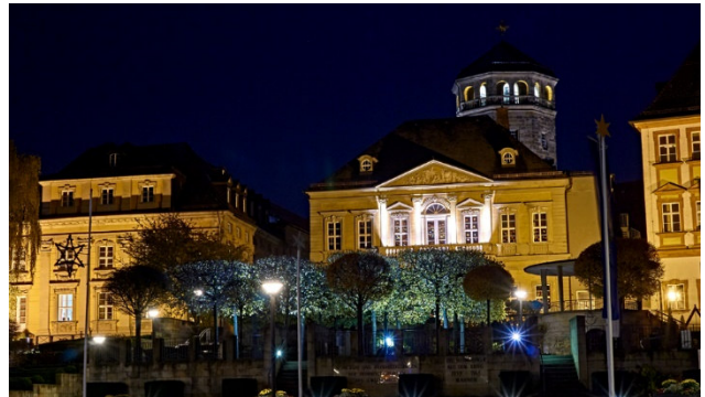
Bayreuth bei Nacht