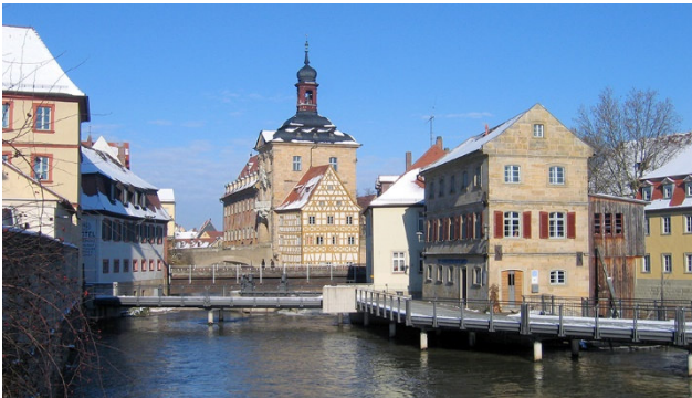
Hinreise mit Zwischenhalt in Bamberg

Weltberühmt wurde Bayreuth durch die Richard-Wagner-Festspiele und hat mit der Wiedereröffnung des Markgräflichen Opernhauses seit 2012 Unesco Welterbe Status erreicht. Kommen Sie mit in die Wagnerstadt Bayreuth und genießen Sie vier unbeschwerte Silvestertage mit uns.