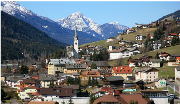
Sillian im Osttirol

Willkommen im Hochpustertal, einer der schönsten Hochalpenregionen Tirols! Sillian, Hauptort des Tiroler Hochpustertales, 1'100 m Seehöhe, im weiten Längstal zwischen den Villgraterbergen, dem Karnischen Kamm und den Dolomiten gelegen, ist ein noch relativ unberührter, gemütlicher Ort und steht auch heute noch für jene Werte, die mancherorts unwiederbringlich verloren sind: Die Natur lässt sich in vollen Zügen genießen. Wir haben jeden Tag ein tolles Programm für Sie zusammengestellt.