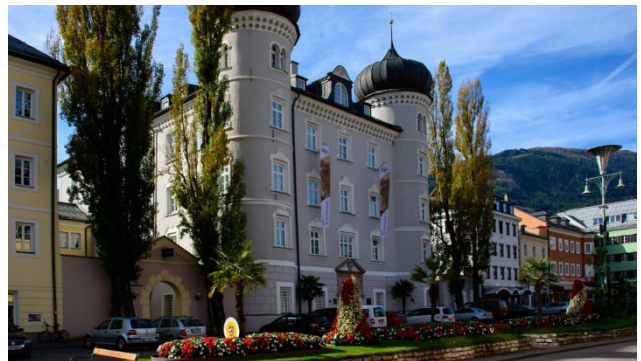
Stadtbummel durch Lienz