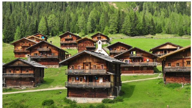
Villgratental mit seinem bäuerlichen und ländlichen Charakter