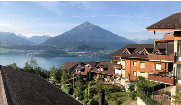
Wunderbare Aussicht auf den Thunersee und die Berner Alpen

Hoch über dem Thunersee liegt das Solbadhotel Sigriswil – das Wohlfühlparadies für Ihre Erholungsferien in der Schweiz. Die einmalige Aussicht auf den See und die Berner Oberländer Alpen mit dem markanten Niesen lassen Ferienstimmung aufkommen. Das familiengeführte Solbadhotel sowie die einzigartige Umgebung bieten ideale Voraussetzungen für entspannte genauso wie für aktive Ferientage.