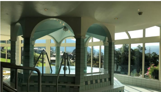
Whirlpool im grosszügigen Wellnessbereich des Solbadhotels