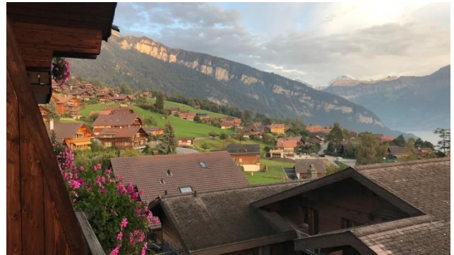
Abendstimmung in Sigriswil