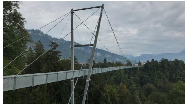
Nur für Schwindelfreie: die Hängebrücke Sigriswil-Aeschelen

■ Traumhafte Landschaft ■ Hoteleigener Wellnessbereich mit Solbad ■ Panoramacard inklusive