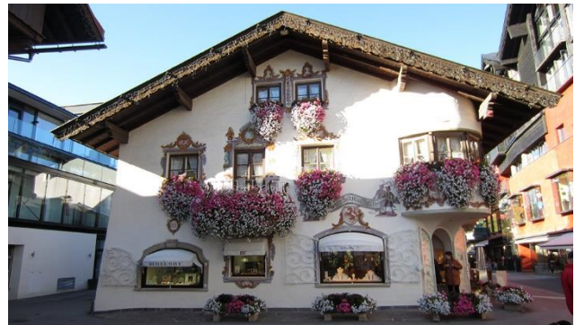
Schönes Haus in Seefeld