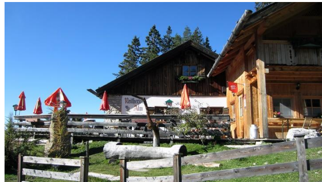
Eine der zahlreichen Jausestationen