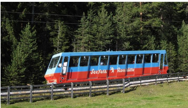
Bahnfahrt auf den Berg für Wanderungen