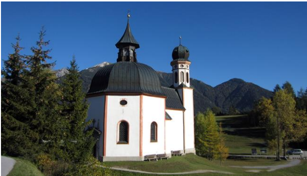
Seekirchl St. Oswald in Seefeld

Die Seefelder Hochebene im Tirol, umgeben von einem herrlichen Gebirgs Panorama zwischen Wettersteingebirge und Karwendel, bietet ein schönes Wandergebiet mit gepflegten Wegen und zahlreichen Hütten. Sie können Bergtouren oder auch kleinere Wanderungen unternehmen. Atemberaubende Gipfel, das Naturschutzgebiet Karwendel, ein gut erschlossenes Wanderwegnetz und gemütliche Hütten bieten Ihnen grenzenlose Möglichkeiten um aktiv zu sein.