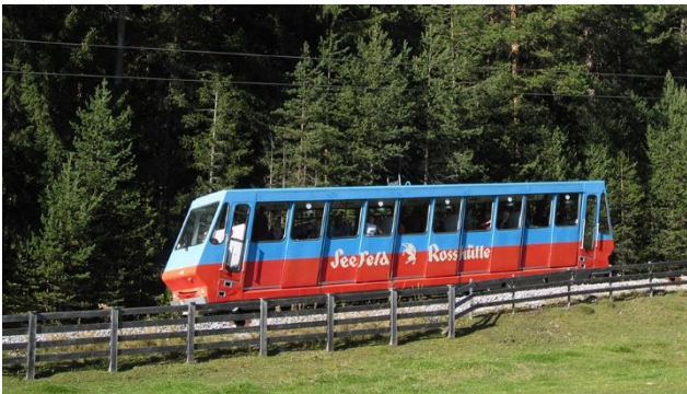
Bahnfahrt auf den Berg für Wanderungen