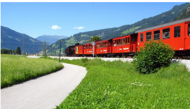
Ausfahrt mit der Zillertalbahn nach Mayrhofen