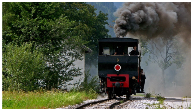
Mit der Achensee-Dampfbahn Fahrt ins Tal