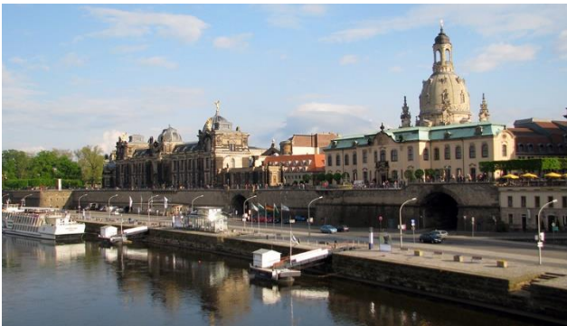
Kulturmetropole Dresden an der Elbe

Im Zentrum dieser Reise steht die barocke Kulturmetropole Dresden. Diese gilt es ebenso zu entdecken, wie das schöne Elbland rundherum. Kommen Sie mit auf eine Schaufelraddampffahrt auf der Elbe von Dresden nach Königstein. Feinste Dampfzugromantik durch die beschaulichen Weinhänge des Elblandes genießen Sie mit der Lössnitzgrundbahn von Moritzburg nach Radebeul.