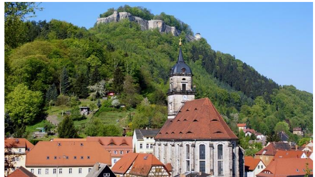
Hoch auf dem Hügel – Festung Königstein