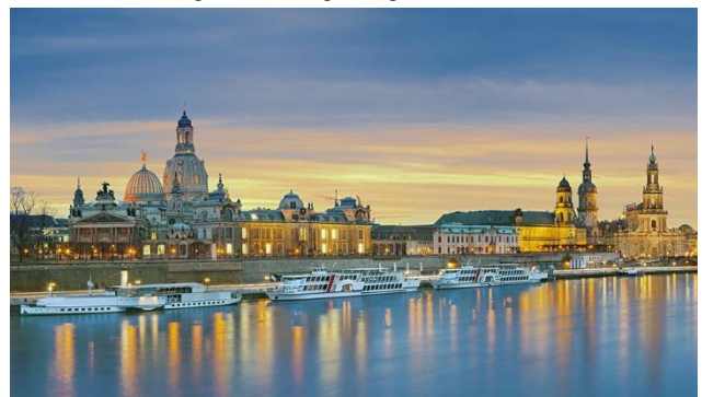
Romantische Abendstimmung in Dresden