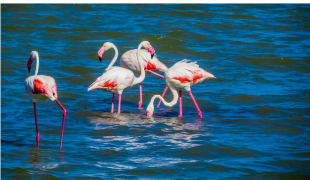
Flamingos an der Costa Rei

Zimmerbezug im Hotel Santa Gilla in Capoterra im Süden der Insel mit Blick auf die Lagune. Gemeinsames Abendessen im Hotel.