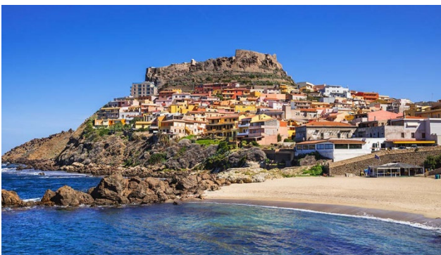
Castelsardo an der Nordküste