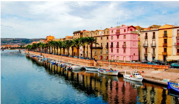
Die sehenswerte Ortschaft Bosa

Sardinien ist die zweitgrösste Insel des italienischen Archipels. Das Bild der ganzen Insel wird von der wilden Schönheit der Natur, sowohl an der Küste als auch im Hinterland geprägt. Weisse Sandstrände, tausende kleine Buchten und türkisblaues Meer ziehen die Menschen an. Prominente und quirlige Badeorte wie Capricioli und Porto Cervo liegen an der weltberühmten Smaragdküste. Die karge Hügellandschaft des Inselinneren bewacht verstreute prähistorische Festungen, Dörfer, Tempel und Grabstätten. Die sogenannten Nuraghen wurden von einem Volk erbaut, dessen Ursprung eines der grossen Geheimnisse der Geschichte darstellt.