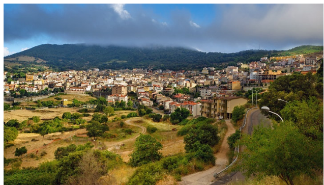
Im Hinterland im Hirtendorf Orgosolo