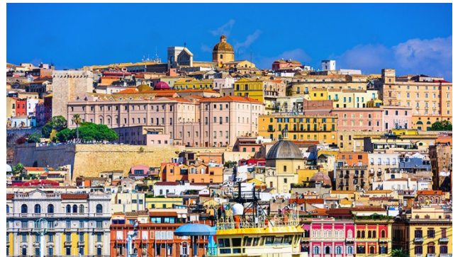
Das geschäftige Cagliari