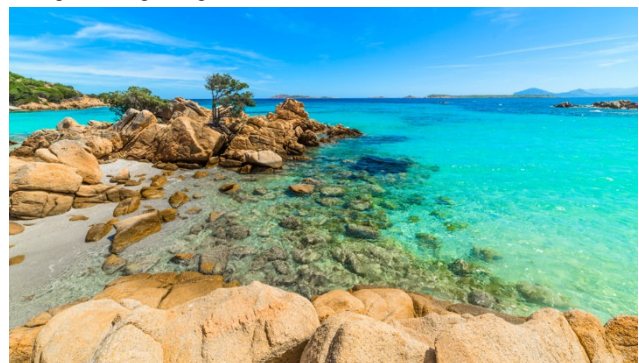
Sie treffen auf traumhafte Strände mit türkisblauem Wasser