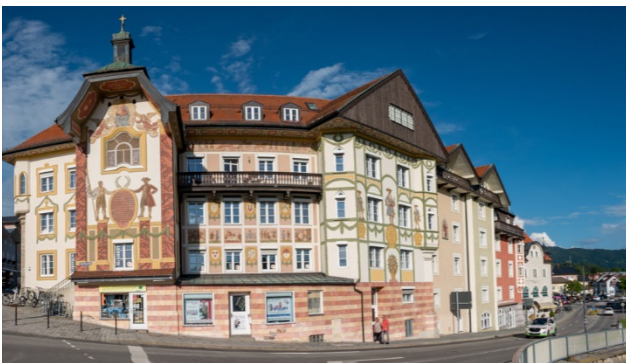
Ihr Übernachtungsort Bad Tölz