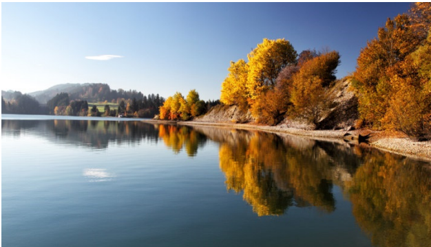
Der Forggensee im Herbstkleid

Das Allgäu zählt zu den beliebtesten Ferienregionen in Deutschland. Die Voralpenlandschaft erfüllt vielen Menschen den Traum einer grünen, stillen und erfrischenden Oase in guter Luft. Es ist genau wie im schönsten Reisebilderbuch: noch grüner sind die Wiesen, noch blauer ist der Himmel, sanft flüstert der Wind durch Gräser und Wälder. In der Ferne wachen die Berge mit ihren weissen, majestätischen Hauben über das Voralpenland; Bäche gurgeln herab in die Täler, Weiher und Seen ruhen still. Wir freuen uns, wenn Sie uns auf dieser schönen Fahrt durchs Allgäu begleiten und mit uns zwei schöne und abwechslungsreiche Tage verbringen!