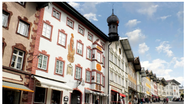
Marktstrasse in Bad Tölz