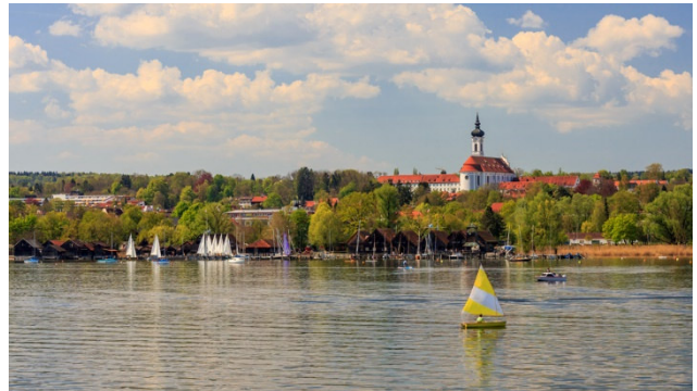
Der Ammersee in Bayern mit Blick auf Diessen