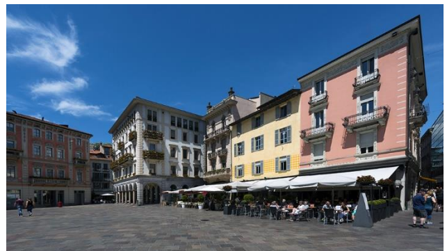
Piazza in Lugano