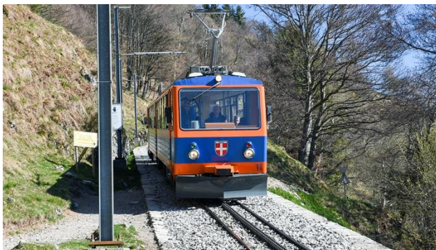
Bahnfahrt auf den Monte Generoso