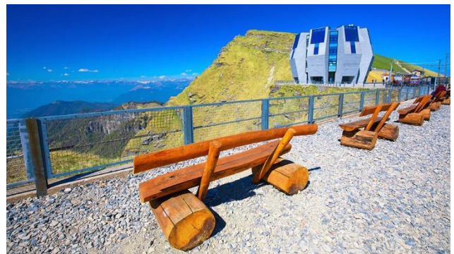
Fiore di Pietra auf dem Monte Generoso