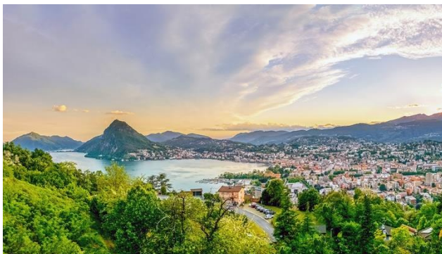
Sicht auf den Luganer See

Das Tessin ist das Tor zum Süden. Es reizt vor allem mit seinem Charme, fasziniert mit Lifestyle und der italienischen Sprache. Jenseits der Alpen empfangen Sie: Mildes Klima, Palmen an idyllischen Stränden, liebeliche Täler, romanische Kirchen und pittoreske Gassen, die sich auf belebte Plätze hin öffnen. Vergangenheit und Zukunft, Nord und Süd, Berg und Tal, Natur und Kultur, Stadt und Land – eine faszinierende Einheit voller Gegensätze. In der Sonnenstube der Schweiz wird Ihnen so einiges geboten: Auf dem 1'704 Meter hohen Aussichtsberg Monte Generoso erfahren Sie bei einer Führung mehr über das architektonische Bauwerk «Fiore di Pietra» des Architekten Mario Botta. Auf einer Extrafahrt mit dem Schiff lassen Sie sich sanft über den Lago di Lugano schaukeln und in Lugano laden die Strandpromenade und die bekannte Einkaufsstrasse Via Nassa zum Flanieren ein. Südländisches Ambiente und ein mediterranes Klima sind inklusive.