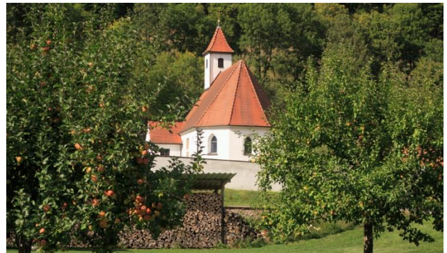
Kirche von Sondernach bei Schelklingen