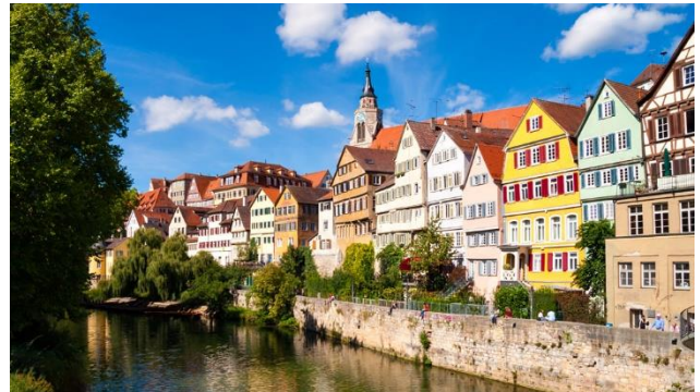
Tübingen am Neckar