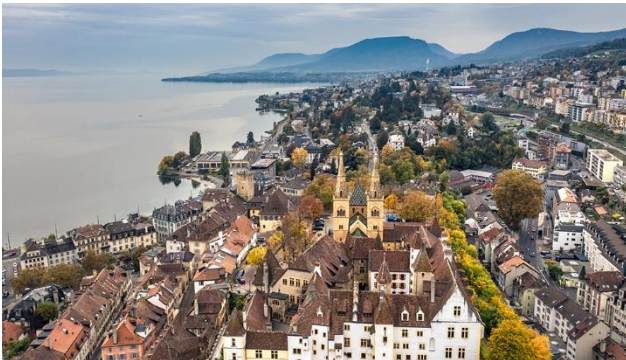
Neuchâtel aus der Vogelperspektive