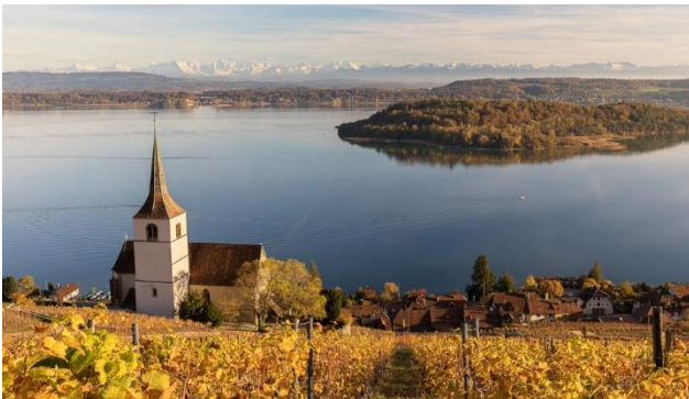
Ligerz am Bielersee

Kommen Sie mit uns auf den Kurztrip in das malerische und hügelige Drei-Seen-Land. Naturnahe Gebiete wechseln sich mit Kulturland wie Gemüsekulturen oder Rebbaugebieten ab. Darin eingebettet liegen die drei grossen Juraseen: Neuenburger-, Bieler- und Murtensee. Auf dieser Reise erleben Sie eine Schifffahrt auf dem Bielersee zur grünen St. Petersinsel, eine idyllische Kutschenfahrt und eine spannende Führung im Maison Tête de Moine. Übernachten werden Sie am schönen Neuenburgersee.