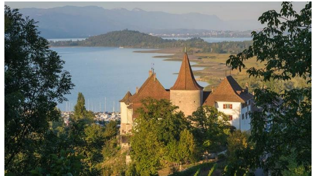
Erlach mit St. Petersinsel