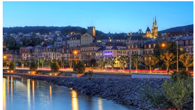
Abendstimmung in Neuchâtel