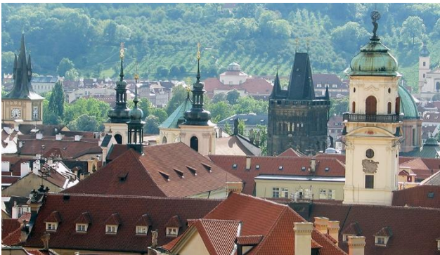
Die Goldene Stadt Prag...

Prag, so sagt man, ist die heimliche Hauptstadt Europas und eine der schönsten Metropolen der Welt. Das von der Unesco ins Weltkulturerbe aufgenommene, geschlossene Ensemble mit seinen Türmen, Kuppeln, zahlreichen Brücken und der eindrucksvollen Silhouette bietet ein Stadtbild von einzigartiger Schönheit.