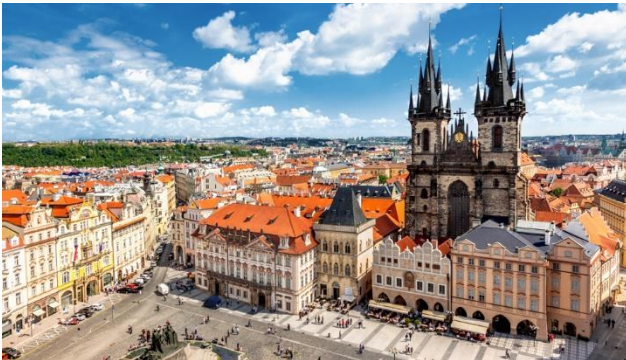
...Sehenswürdigkeiten wird Sie begeistern!