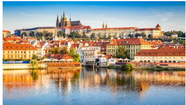
...mit ihren zahlreichen....