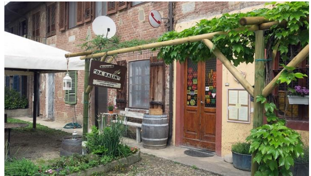
Sie genießen feine Spezialitäten in typischen «Ristoranti».