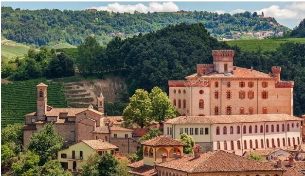
Das berühmte Winzerdorf Barolo mit seinem Schloss.

Eingebettet in eine Gegend, die durchzogen ist von historischen Burgen und Schlössern, schmeicheln ausgedehnte Weinberge dem Auge. Die abwechslungsreiche Landschaft des Piemonts fasziniert mit lieblichem, fast mediterranem Ambiente, während im Westen, an der Grenze zu Frankreich, die wilde Natur der Gebirgstäler nicht nur Wanderer in ihren Bann zieht. Im Südosten liegt das „Schlemmergebiet“ der Langhe und Roero, im Nordosten das wasserreiche Gebiet der Poebene, die neben der Reisproduktion auch das Zentrum der Tuchweberei ist.