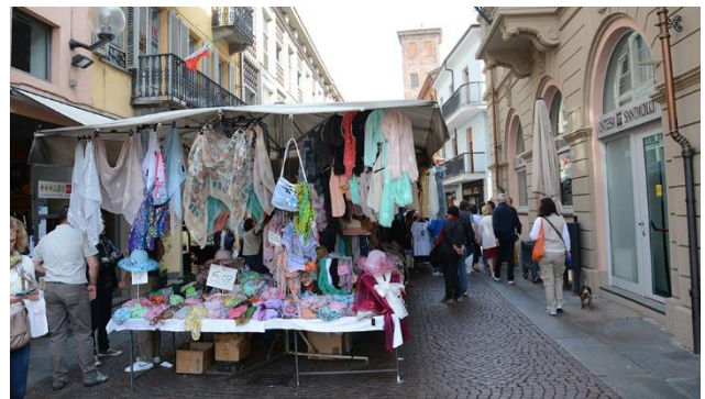
Jeden Samstag findet in Albas Altstadt ein Wochenmarkt statt.