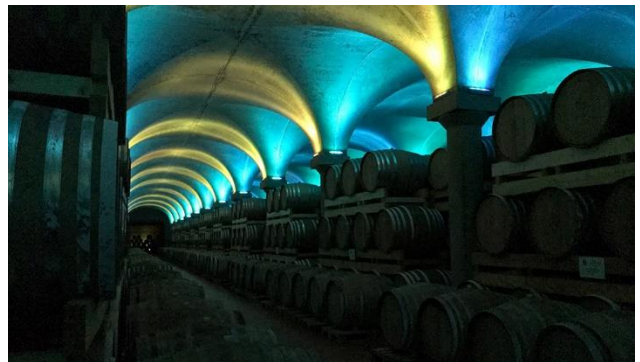
Keller der Grappa-Distillerie Berta