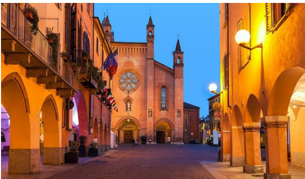
Alba, Ihr Aufenthaltsort

Eingebettet in eine Gegend, die durchzogen ist von historischen Burgen und Schlössern, schmeicheln ausgedehnte Weinhänge dem Auge. Die abwechslungsreiche Landschaft des Piemonts fasziniert mit lieblichem, fast mediterranem Ambiente. Im Südosten liegt das «Schlemmergebiet» der Langhe und Roero, im Nordosten das wasserreiche Gebiet der Poebene, bekannt für die Reisproduktion.