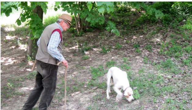
Trüffelsuche, auf den Spuren der Piemonteser Spezialität