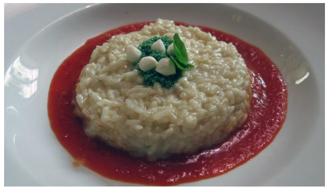
Feine Spezialitäten, erwarten Sie