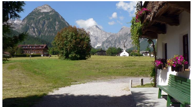
Genüsslich die Mittagssonne genießen