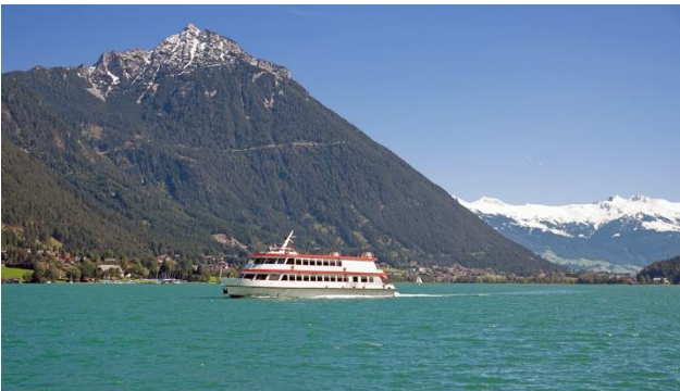
Die Region Achensee und Ihr Ferienort

Pertisau am Westufer des Achensees begeistert mit Tradition und Moderne, gepflegter Gastlichkeit und einmaligen Naturerlebnissen. Treten Sie vor die Hoteltüre und los geht's in die traumhafte Landschaft! Ein paar Schritte und die Karwendel-Bergbahn bringt Sie auf den Zwölferkopf. Fahren Sie mit der Rofan-Seilbahn zur Erfurter Hütte oder wandern Sie in Steinberg auf die Gufferthütte. In Pertisau befindet sich zudem die Hauptanlegestelle der Achenseeschifffahrt. Seit 1887 verbindet diese die Orte Achenkirch, Maurach und Pertisau. Genießen auch Sie eine abwechslungsreiche Schifffahrt.