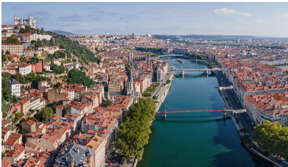
Charmante Stadt Lyon

Lyon, die Stadt zwischen Rhône und Saône, ist bekannt für ihre Spitzengastronomie, aber auch als kulturelle Hochburg, für ihre Seidenweberei, ihre bemalten Hauswände und als Stadt des Lichts und des Kinos. Die herrliche Altstadt und ein Teil der Halbinsel zwischen Rhône und Saône gehören zum UNESCO Weltkulturerbe.