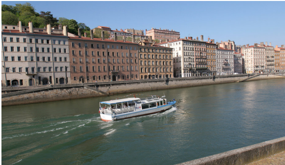
Entlang der Rhone Promenade