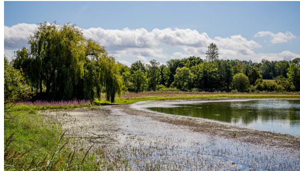
Unterwegs im Dombes-Gebiet