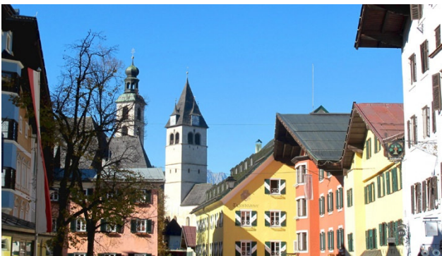
Prominente Ort Kitzbühel