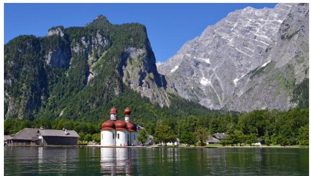
Am Königsee mit St. Barolomä