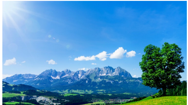
Alpenpanorama in Ihrer Ferienregion