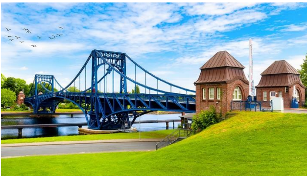
Kaiser Wilhelmsbrücke und ...