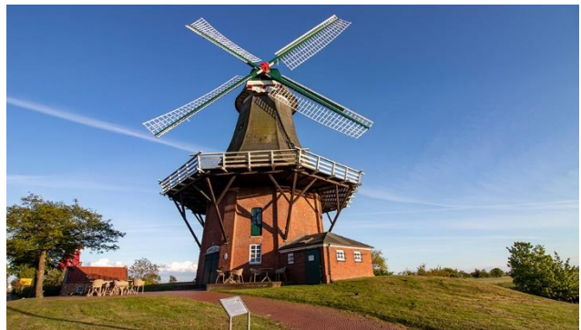
Windmühle in Greetsiel