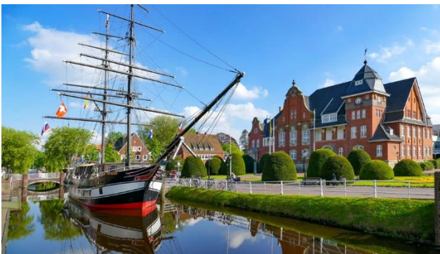
Rathaus mit Friedericke und ...

Windmühlen und Klappbrücken, romantische Kutterhäfen und malerische Küstenorte wechseln mit feinen Sandstränden, bizarren Wolkenbildern und endloser Weite. Deiche mit Schafen, Strandkörbe und Sandburgen, Sonne und Wind – Ostfriesland ist eine exzellente Urlaubslandschaft mit viel frischer Meeresluft und gesundem Klima. Typisch für diesen Landstrich ist die, durch schnurgerade Wasserkanäle gegliederte, Moorlandschaft „der Fehn“ sowie romanische und gotische Backsteinkirchen, Burgen und Schlösser. Erleben Sie diese einmalige Vielfalt. Sie werden sehen, Ostfriesland ist eine Reise wert.