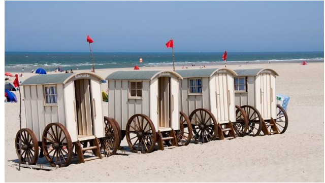
Badekarren auf Norderney