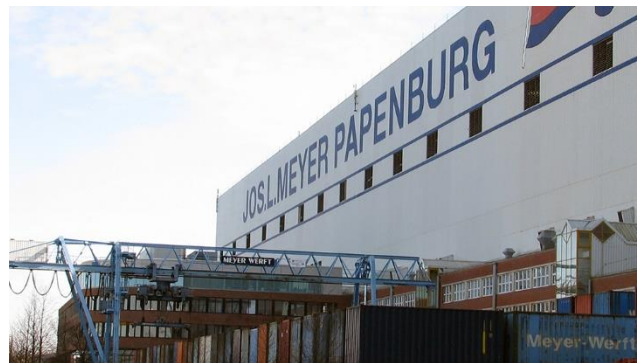
Meyer-Werft in Papenburg