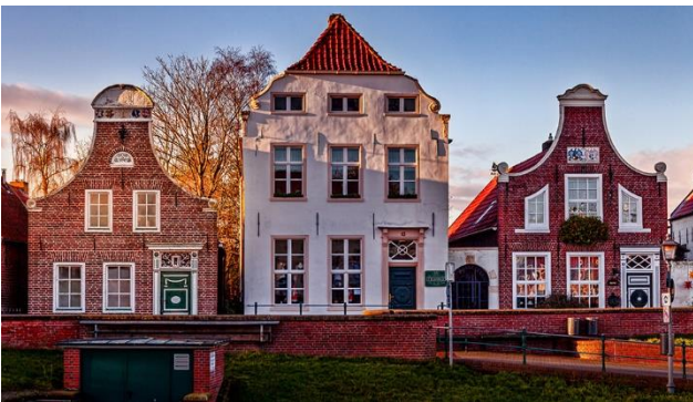
Typische Häuser und ...

Nach dem Frühstück erwartet Sie bereits die Reiseleitung um mit Ihnen das vielfältige Ostfriesland zu entdecken: romantische Warfendörfer, Landschaftsformen mit typischen Dünen, Salzwiesen und einer einmaligen Wattenmeerlandschaft, lebendige Fischerhäfen, bunte Leuchttürme und sieben Inseln im blauen Meer. An der Westküste erwartet Sie eines der bekanntesten Wahrzeichen Ostfrieslands: der Pilsumer Leuchtturm. Kurzer Fotostopp. Anschliessend erreichen Sie Greetsiel. Der Küstenort ist bekannt für seinen Hafen mit Fischrestaurants, zwei Windmühlen, traditionellen Fischerbooten und Backsteinhäusern aus dem 18. Jahrhundert, deren Giebel meist mit einem Familienwappen versehen sind. Zurück fahren Sie durch das Landesinnere vorbei an Aurich – Wittmund – Jever nach Wilhelmshaven.