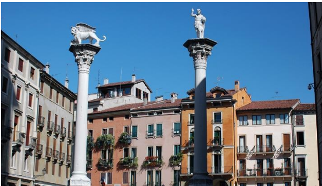
Vicenza in Venetien

Das Proseccogebiet ist vor allem bekannt für den frischen, trockenen Schaumwein, mit welchem eine Mahlzeit eröffnet werden kann. Jedoch ist dieses Gebiet im Veneto, welches zwischen Conegliano und Valdobbiadene liegt, auch landschaftlich sehr reizvoll.