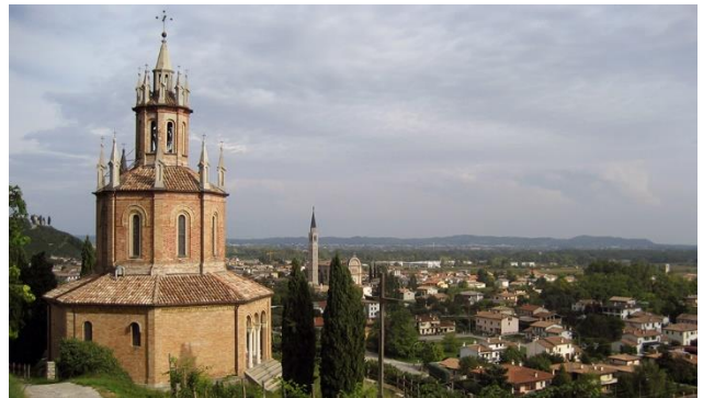
Proseccogebiet in Venetien