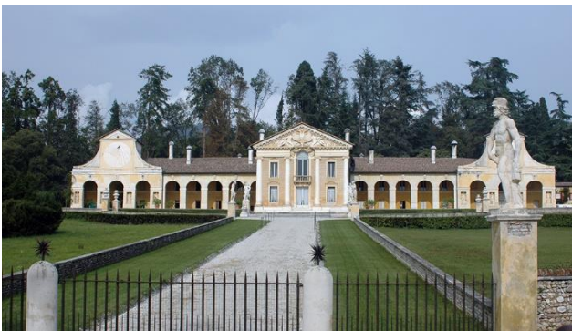
Villa Barbaro von Andrea Palladio