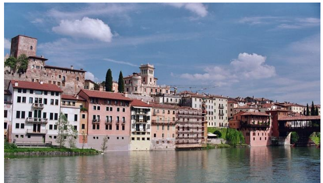
Bassano del Grappa