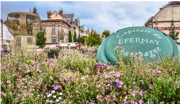
Epernay – Capitale du Champagne

Lassen auch Sie sich von diesem tanzendem Perlenspiel verzaubern und folgen Sie auf Ihrer Reise dem legendären Ruf dieses edlen Schaumweins. Aber nicht nur Champagner prägt das Gesicht der Region. Sehenswert sind auch die Städte der Champagne sowie viele kleine malerische Orte wie Hautvillers, in der die Geschichte des Champagners ihren Anfang nahm.