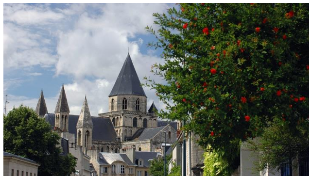
Caen Abbey aux hommes