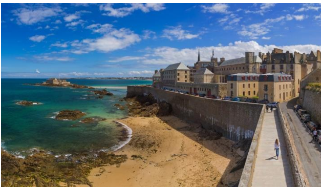
Stadtmauer in Saint-Malo

Mit der Fähre erreichen Sie ab der bretonischen Hafenstadt Saint-Malo die Insel Jersey. Die grösste der Kanalinseln wartet mit der farbenfrohen und lebhaften Hafenstadt Saint Helier auf Ihren Besuch. Die Küstenlandschaft ist sehr unterschiedlich – im Norden mit steilen, schroffen Klippen und auf der anderen Seite mit schönen Sandstränden. Die Insel hat einen besonderen Lebensstil entwickelt – die ideale Kombination zwischen britischer Tradition und französischem Savoir-vivre.