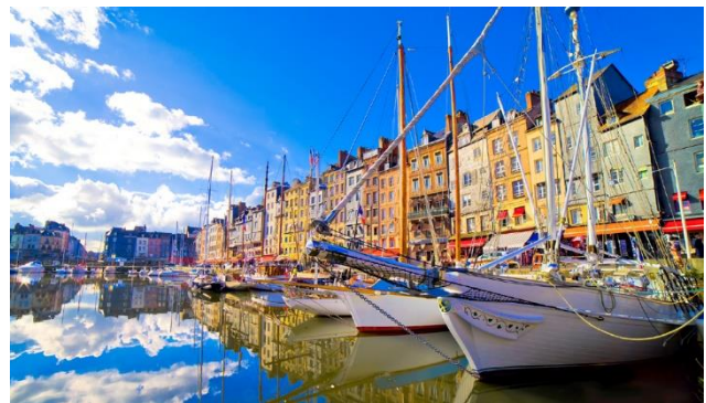
Hafen von Honfleur