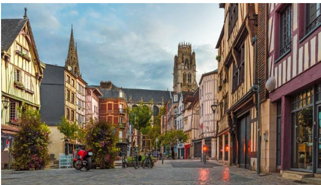
Rouen - Place du Lieutenant-Aubert