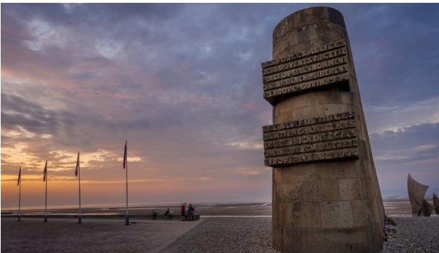
Omaha Beach Memorial

Am Nachmittag fahren Sie dann zurück nach Caen und haben Zeit für eigene Entdeckungen. Diese Stadt ist vor allem für ihre zahlreichen Kirchen, Abteien und das Schloss bekannt. Von den Wehrgängen des Schlosses hat man einen guten Ausblick über die Stadt mit ihren schnurgeraden Alleen, Parks und Gärten. Caen wurde während des 2. Weltkrieges grösstenteils zerstört und ist nach einem neuen Stadtplan wieder aufgebaut worden. Das Musée Méorial ist ein Besuch wert und informiert umfassend über die Zeit der beiden Weltkriege. Im Musée des Beaux-Arts sind Meisterwerke von Monet, Bonnard, Poussin und Dürer ausgestellt. Das Abendessen geniessen Sie individuell in einem der zahlreichen Restaurants in der Altstadt.