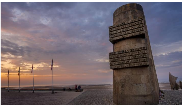
Omaha Beach Memorial

Am Nachmittag fahren Sie dann zurück nach Caen und haben Zeit für eigene Entdeckungen. Diese Stadt ist vor allem für ihre zahlreichen Kirchen, Abteien und das Schloss bekannt. Von den Wehrgängen des Schlosses hat man einen guten Ausblick über die Stadt mit ihren schnurgeraden Alleen, Parks und Gärten. Caen wurde während des 2. Weltkrieges grösstenteils zerstört und ist nach einem neuen Stadtplan wieder aufgebaut worden. Das Musée Mémorial ist ein Besuch wert und informiert umfassend über die Zeit der beiden Weltkriege. Im Musée des Beaux-Arts sind Meisterwerke von Monet, Bonnard, Poussin und Dürer ausgestellt. Das Abendessen geniessen Sie individuell in einem der zahlreichen Restaurants in der Altstadt.