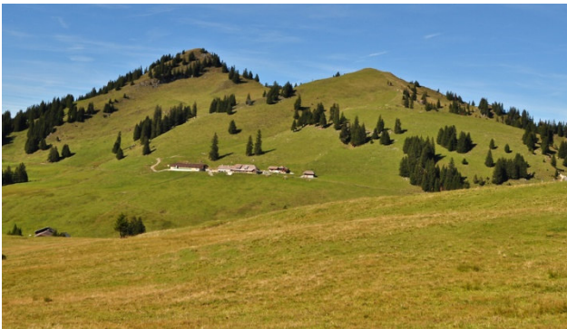
Hinreise über den Glaubenbergpass

Willkommen im Herzen der Schweiz. Genau der richtige Ort, um den Nationalfeiertag zu verbringen. Wir bringen Sie an beiden Tagen auf Alpenpässe mit wunderschöner Aussicht. Am Abend darf eine Schifffahrt natürlich nicht fehlen. Erleben Sie das einmalige Spektakel: Schifffahrtskorso auf dem Vierwaldstättersee mit Feuerwerk in Brunnen.