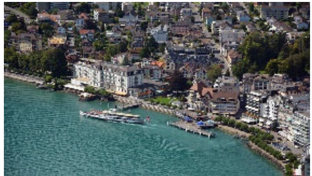
Ihr Übernachtungsort Brunnen