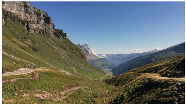
Heimreise über den Klausenpass