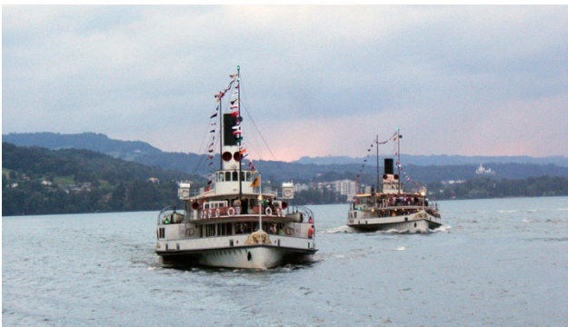
Abendschifffahrt auf dem Vierwaldstättersee mit Feuerwerk